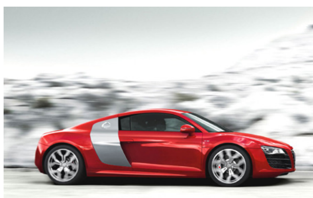
Audi R8 V10