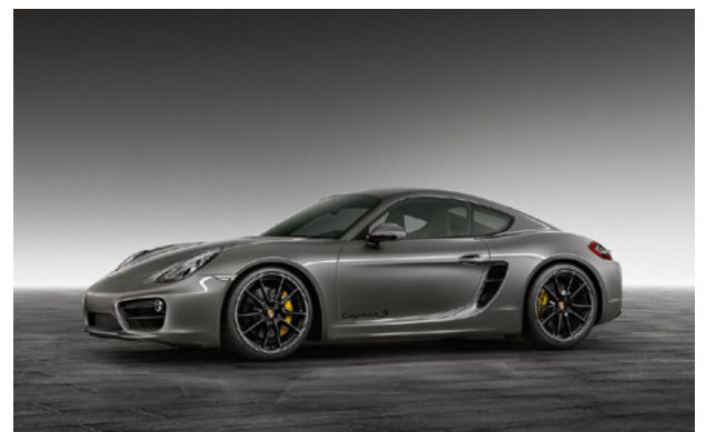
Porsche Cayman S