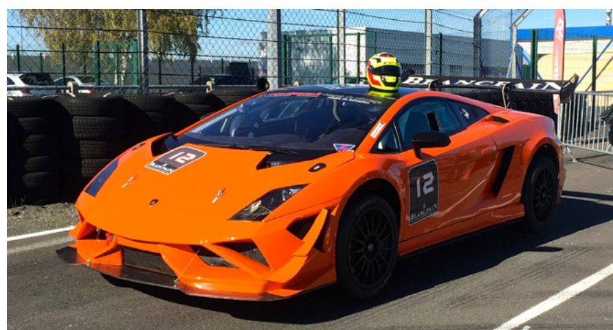
Lamborghini Super Trofeo