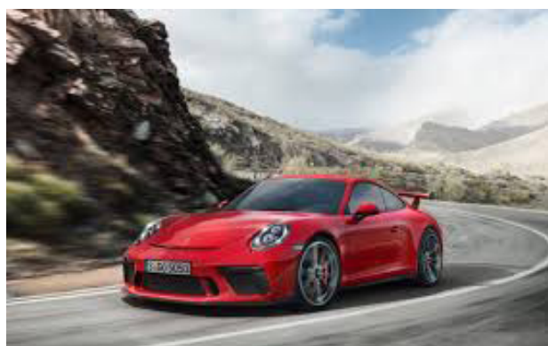
Porsche 991 GT3 Phase 2