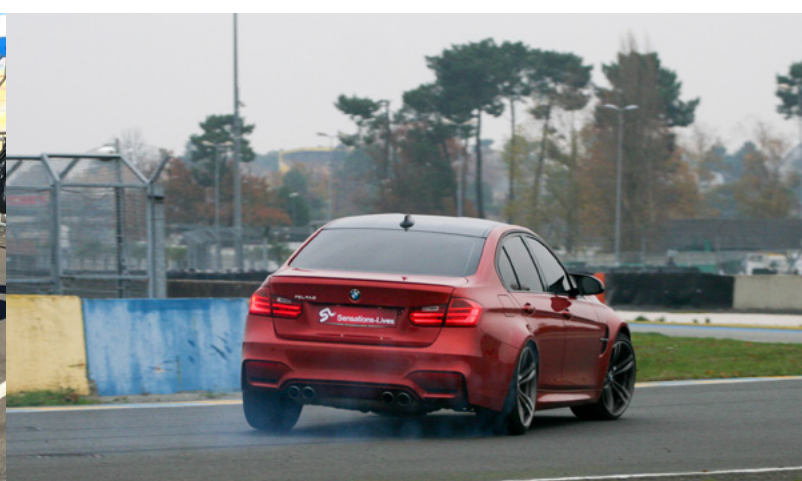
BMW M4 DKG 431