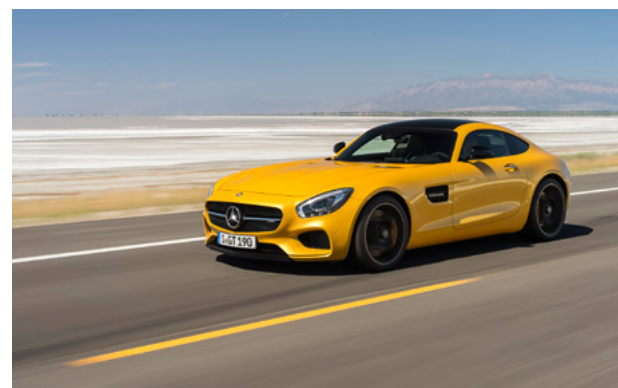
Mercedes AMG GT