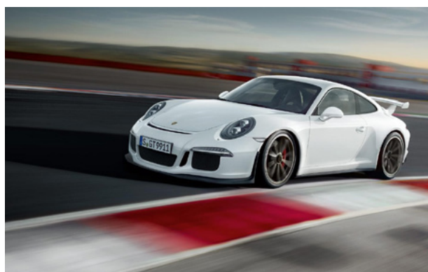
Porsche 997 GT3